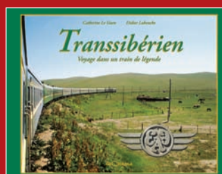
Transsibérien, Voyage dans un Train de Légende