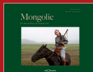
Mongolie, Un été au Pays du Grand Ciel