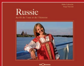
Russie, au fil de l'eau et de l'histoire