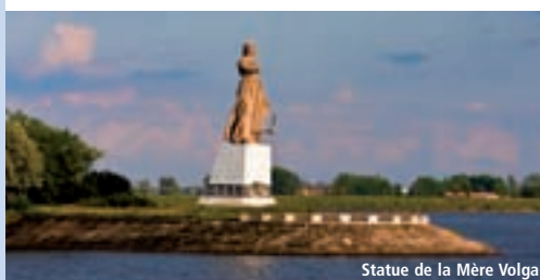
Statue de la Mère Volga

J 3. ST-PETERSBOURG : visite guidée du célèbre musée de l'Ermitage, l'un des plus vastes au monde avec ses 3 millions d'œuvres d'art. Visite de la cathédrale St Isaac, la plus imposante de St-Pétersbourg. La colonnade de sa coupole d'or offre un panorama splendide sur la ville. Retour à bord. ✂ à bord. L'après-midi libre (possibilité d'excursions facultatives : voir le forfait des excursions proposé ci-contre). ✂ et 🚗 à bord.