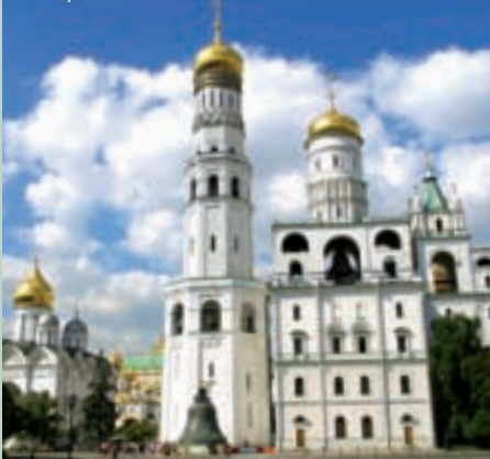
Moscou, le Kremlin

Important : s'il n'est pas possible d'assurer la réservation de compartiments individuels dans le train, nous pouvons proposer aux personnes seules une formule « compartiment à partager », sous réserve de demandes similaires.