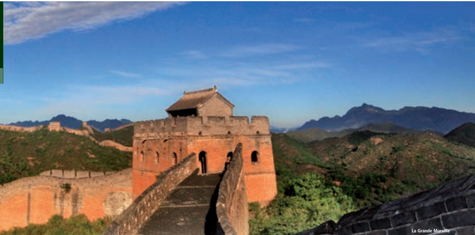
La Grande Muraille

compartiments des marchands mongols. ➡ à bord en compartiment à 4 couchettes de 2 nd e classe.