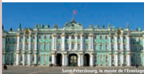
Saint-Pétersbourg, le musée de l'Ermitage

J 5. MOSCOU : le matin, arrivée en gare de Moscou et transfert pour le petit déjeuner. Journée consacrée à la découverte de la capitale russe. Visite guidée panoramique du quartier historique : la Place Rouge, la cathédrale Basile-le-Bienheureux et ses clochers multicolores, le Bolchoï, la Douma... Visite du Blockhaus de Staline, qu'il occupa avec son état major lors de l'avancée des troupes allemandes aux portes de Moscou. ✂ à l'intérieur du blockhaus. L'après-midi, visite guidée du superbe monastère de Novodievitchi : les coupes et les clochers de ses églises vous émerveilleront. Ce monastère abrite aussi des tombes, dont celles de Gogol, Tchekhov, mais encore celles de Molotov, Khrouchtchev, de Raïssa Gorbatchev et Boris