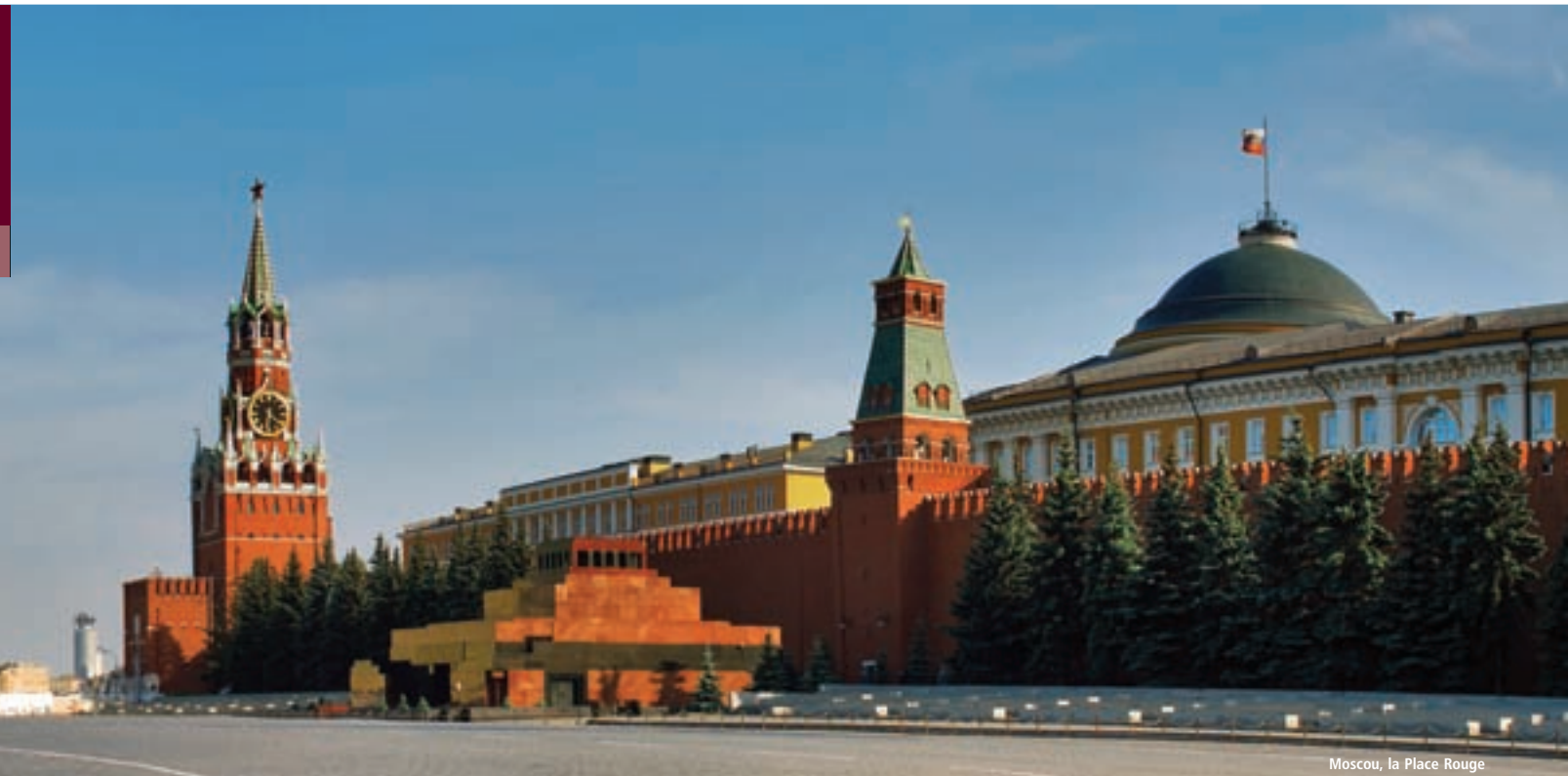
Moscou, la Place Rouge

Elt sine (sous réserve d'ouverture au public). En soirée, vous assisterez à une représentation folklorique du ballet national russe « Kostroma » (ce spectacle est programmé pour les départs du 12/06 au 11/09 inclus). ✂ et 🚗 à l'hôtel. A Moscou, vous séjournerez à l'hôtel Cosmos 4**** situé en face du parc VDNKH ou à l'hôtel Holiday Inn Lesnaya 4**** situé près de la gare de Biélorussie à Moscou.