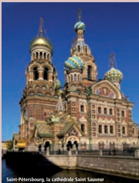
Saint-Pétersbourg, la cathédrale Saint Sauveur

VISITES DE LA CITÉ DES ÉTOILES ET DU BLOCKHAUS DE STALINE