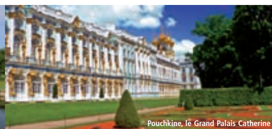
Pouchkine, le Grand Palais Catherine

Note prix comprend : • Les vols réguliers Air France Province / Paris / St-Pétersbourg et Moscou / Paris / Province • Les taxes aériennes et de sécurité (143 € de Paris et 223 € de Province avec Air France au 30/10/11) • Le trajet en train-couchettes de nuit Saint-Pétersbourg / Moscou en compartiment à usage double de 1 re ou 2 e classe • L'hébergement en hôtels 4**** (normes russes) en chambre double • La pension complète du dîner du J1 au petit déjeuner du J8 • L'eau minérale et le thé ou le café lors des repas • Les entrées et visites prévues au programme • La représentation du cirque de Moscou • Les services de guides-accompagnateurs à Saint-Pétersbourg et à Moscou • L'assurance assistance rapatriement. Notre prix ne comprend pas : • Le transfert en autocar ville de départ-aéroport de