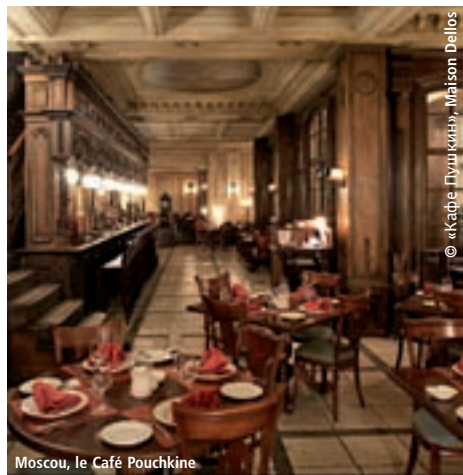
Moscou, le Café Pouchkine

NB : le programme est sous réserve de modifications dans l'ordre des visites.