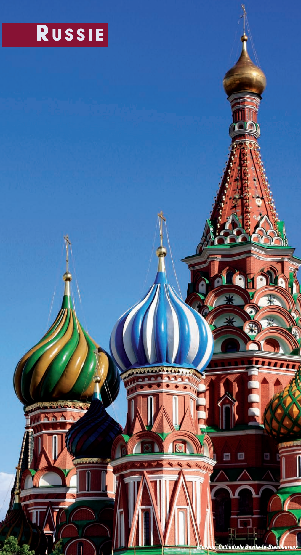
Moscou, Cathédrale Basile-le-Bienheureux